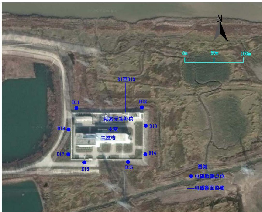
图 3.1-1 220kV 江苏东台风电场二期北风电场变电站平面布置及监测点位图