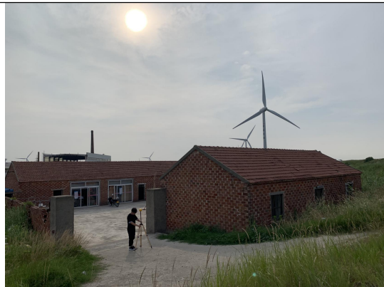
空置房屋（尖顶砖房）