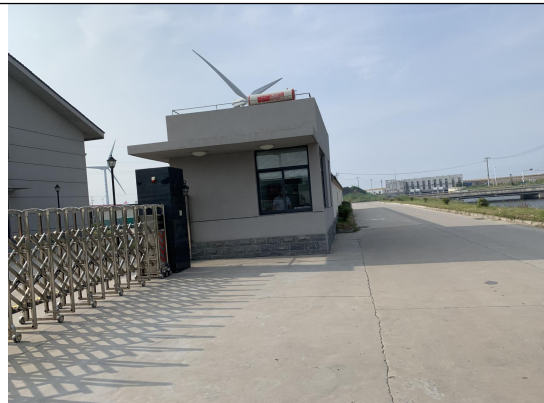
华能如东八仙角海上风力发电有限责任公司 门岗