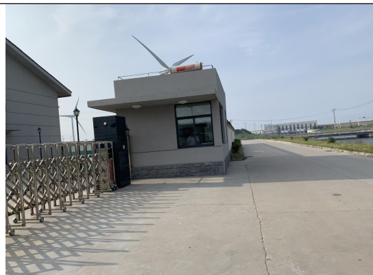
华能如东八仙角海上风力发电有限责任公司门岗