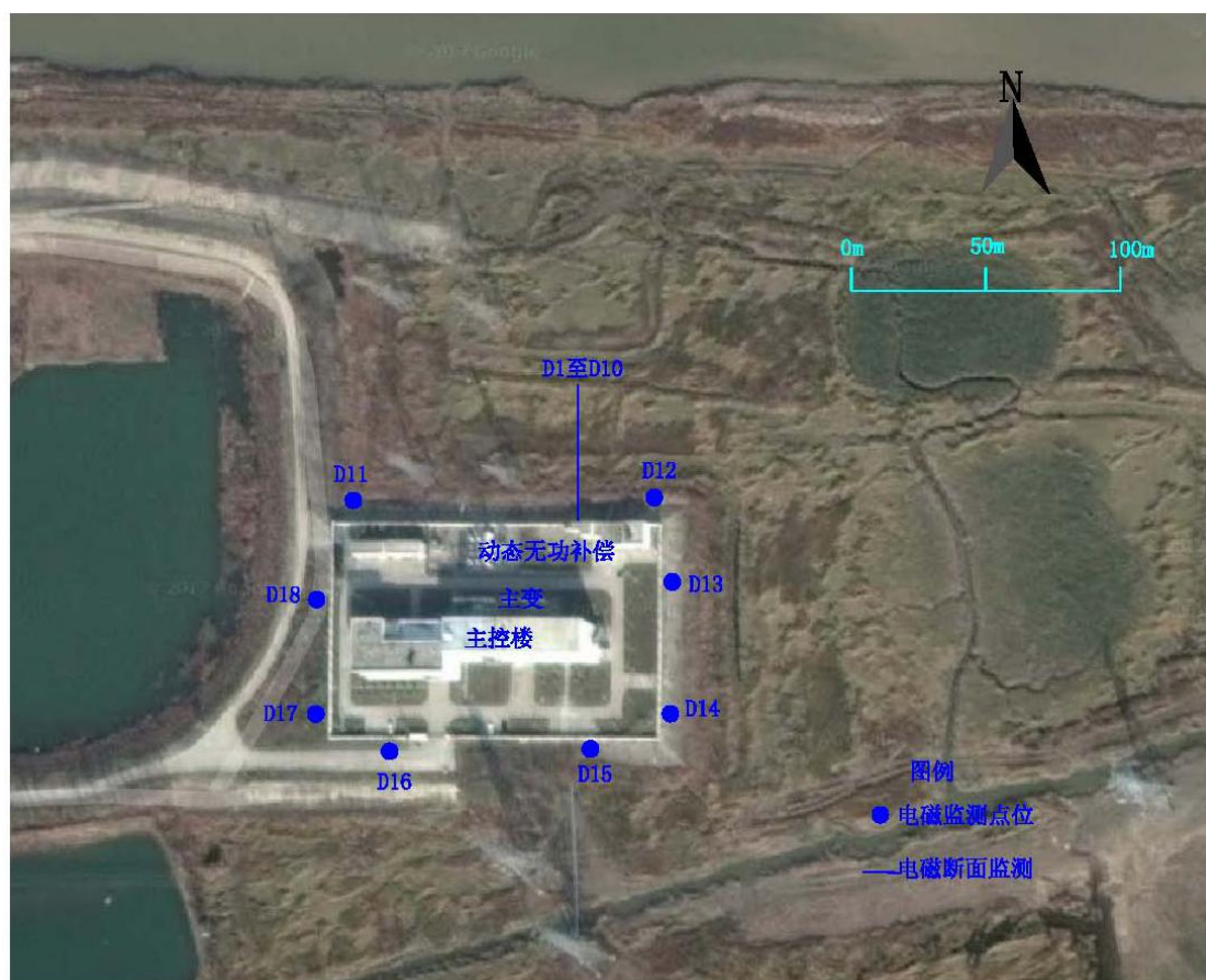
图 3.1-1 220kV 江苏东台风电场二期北风电场变电站平面布置及监测点位图