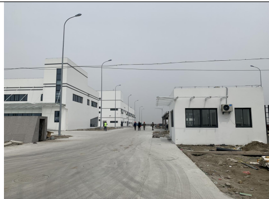
上海电气风电如东有限公司门岗